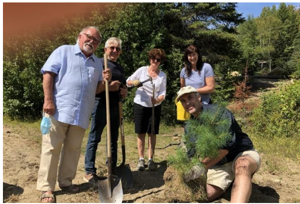
LÉGENDE : plantation d'arbres sur la plage des Pins, 2021

2021 : Les usages permis au règlement de zonage s'appliquant à une grande partie du bassin versant du lac Sarrazin ont été amendés suite aux demandes de l'Association des propriétaires du lac Sarrazin (APLS) délimitant ainsi la zone Res-05 en regard aux locations à court terme. Une grande réussite de l'APLS !