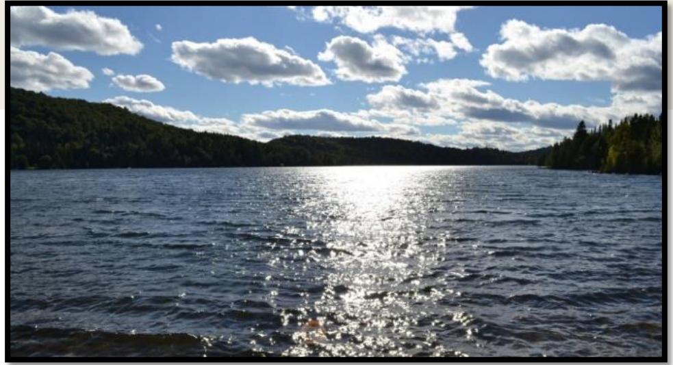
LÉGENDE DE L'IMAGE : Lac Sarrazin, 2023