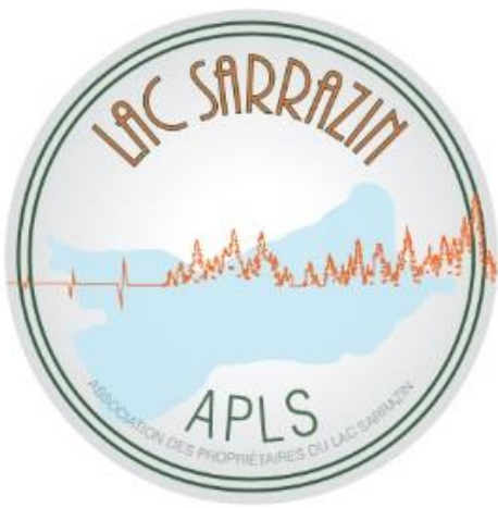
Logo officiel de l'Association des propriétaires du Lac Sarrazin, 2021

Merci spécial aux membres des différents CA de l'APLS pour leur dévouement à la protection du Lac